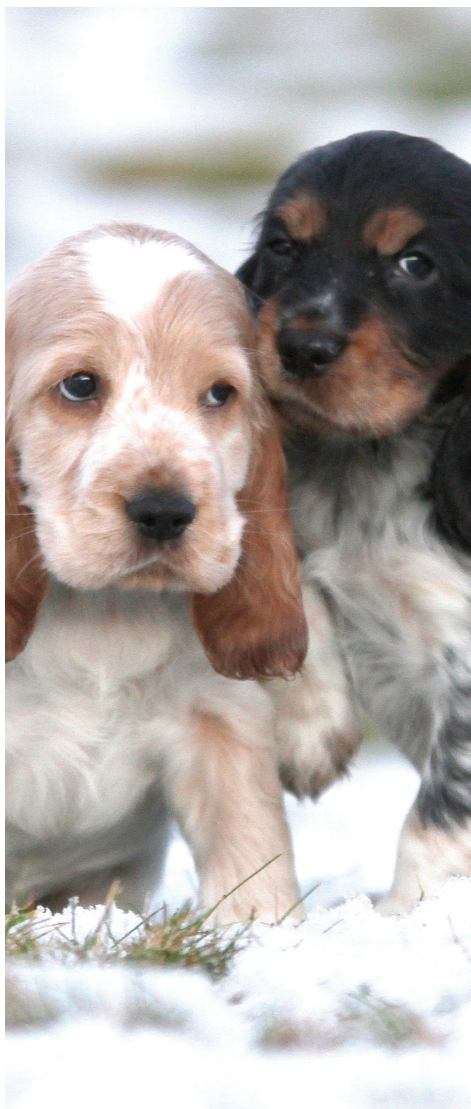
COCKER SPANIEL.

Reaksjonsmåter for brudd på grunnreglene er vedtatt av HS 11.11.2011.