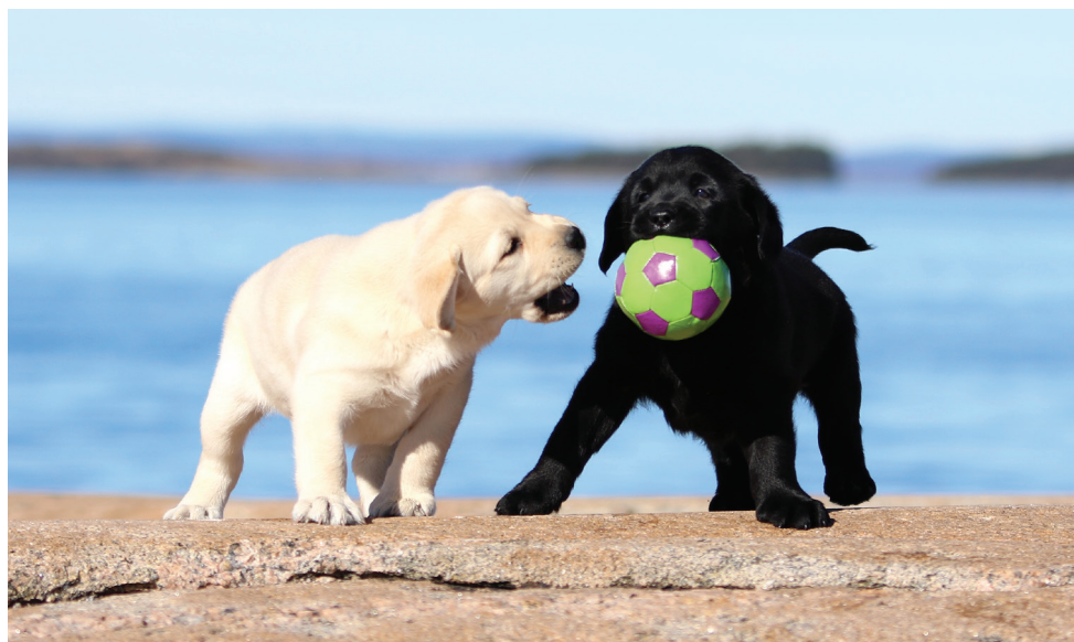
LABRADOR RETRIEVER.

omtales som rasepopulasjonen også bør inkludere populasjonen i de mest aktuelle samarbeidsland, for eksempel Norden.