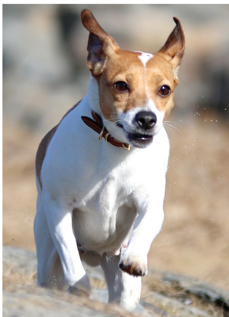
DANSK-SVENSK GÅRDSHUND.

4.1. Bare funksjonelt, klinisk friske hunder skal brukes i avl. Hvis nære slektninger av en hund med en kjent eller antatt arvelig sykdom brukes i avl, bør den pares med en hund som kommer fra en familie med lav eller ingen forekomst av tilsvarende sykdom.