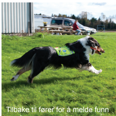
Tilbake til fører for å melde funn