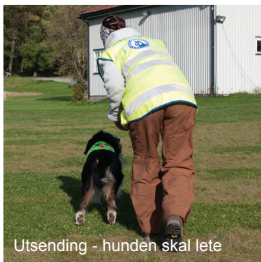
Utsending - hunden skal lete