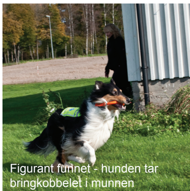
Figurant funnet - hunden tar bringkobbet i munnen