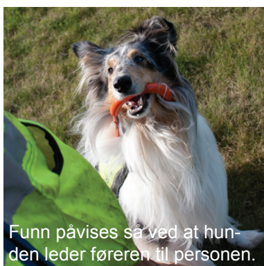
Funn påvises så ved at hunden leder føreren til personen.