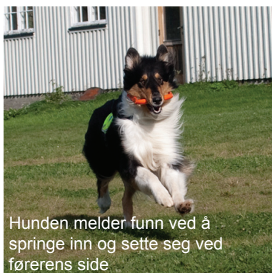
Hunden melder funn ved å springe inn og sette seg ved førerens side